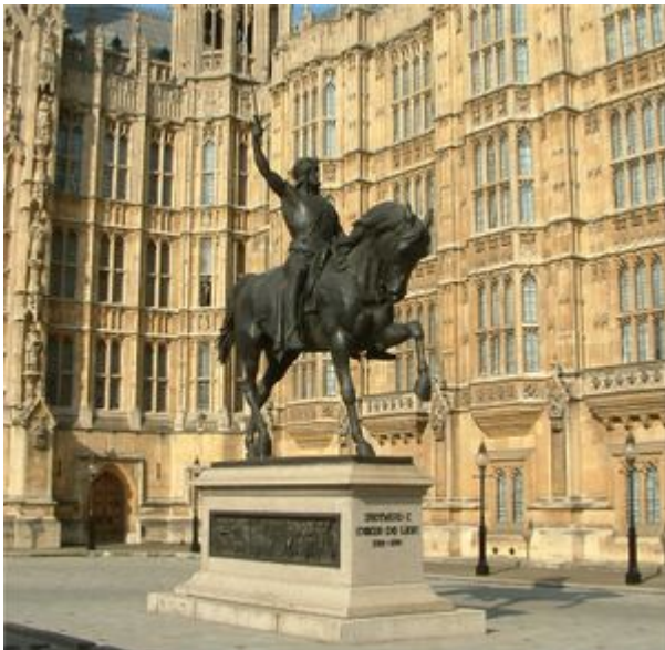
ਇੰਗਲਿਸਤਾਨ ਦੇ ਰਿਚਰਡ ਸ਼ੇਰਦਿਲ ਦਾ ਲੰਦਨ ਦੇ ਵੈਸਟ ਮਨੀਸਟੇ ਮਹਿਲ

ਹੁੰਮਸ ਤੇ ਮਿਲ ਮਾਰਨ ਦੇ ਮਗਰੋਂ ਸਲੀਬੀਆਂ ਨੇ ਬੀਤ ਅਲ ਮੁਕੱਦਸ ਦਾ ਮੁਹਾਸਿਰਾ ਕਰ ਲਈਆ , ਚੁੰਕਿ ਫ਼ਾਤਮੀਆਂ ਵੱਲੋਂ ਸ਼ਹਿਰ ਦੀ ਹਿਫ਼ਾਜ਼ਤ ਦਾ ਕੋਈ ਖ਼ਾਤਿਰ ਖ਼ਾਹ ਇੰਤਜ਼ਾਮ ਨਈਂ ਕੀਤਾ ਗਈਆ ਸੀ , ਇਸ ਲਈ 15 ਜੂਨ 1099ਈ. ਚ ਇਨ੍ਹਾਂ ਮਜ਼੍ਹਬੀ ਜਨੂੰਨੀਆਂ ਨੇ ਬਹੁਤ ਅਸਾਨੀ ਨਾਲ ਕਬਜ਼ਾ ਕਰ ਲਈਆ । ਬੀਤ ਅਲ ਮੁਕੱਦਸ ਦੀ ਹੁਰਮਤ ਦਾ ਵੀ ਕੋਈ ਖ਼ਿਆਲ ਨਾ ਰਖਈਆ ਗਈਆ ਤੇ ਮੁਸਲਮਾਨਾਂ ਦਾ ਬੜੀ ਬੇਦਰਦੀ ਨਾਲ ਕਤਲ-ਏ-ਆਮ ਕੀਤਾ ਗਈਆ ਤੇ ਇਨ੍ਹਾਂ ਦਾ ਸਾਰਾ ਮਾਲ ਅਸਬਾਬ ਲੁੱਟ ਲਈਆ ਗਈਆ । ਯੂਰਪੀ ਮੂਰਖ ਵੀ ਇਨ੍ਹਾਂ ਸ਼ਰਮਨਾਕ ਜ਼ੁਲਮਾਂ ਦੀ ਹਕੀਕਤ ਨੂੰ ਤਸਲੀਮ ਕਰਦੇ ਨੇਂ ।