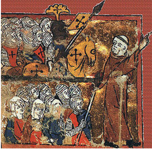
ਪੀਟਰ ਦੀ ਇੱਕ ਕਰੌਣ ਵਸਤੀ ਦੀ ਮੂਰਤ ਜਿਸ ਚ ਉਹ ਨਾਇਟਾਂ, ਫੌਜੀਆਂ ਤੇ ਜ਼ਨਾਨੀਆਂ ਦੀ ਪਹਿਲੀ ਸਲੀਬੀ ਜੰਗ ਚ ਅਗਵਾਈ ਕਰ ਰਹੀਆਂ ਹਨ

ਨੂੰ ਜਾਇਦਾਦ ਚੋਂ ਘੱਟ ਹਿੱਸਾ ਮਲਈਆ ਸੀ ਤੇ ਉਹ ਜਿਨ੍ਹਾਂ ਦੀ ਖਵਾਹਿਸ਼ ਸੀ ਉਹ ਮਾਲ ਤੇ ਦੌਲਤ ਕਮਾਵਣ , ਉਹ ਰਾਹਬ ਜਿਹੜੇ ਖ਼ਾਨਕਾਰੀ ਜੀਵਨ ਦੀਆਂ ਸਖ਼ਤੀਆਂ ਤੋਂ ਤੰਗ ਸਨ । ਗ਼ਰਜ਼ ਕੱਲ੍ਹ ਭੈੜੇ ਹਾਲਾਂ ਆਲੇ ਤੇ ਵਿਰਾਸਤ ਤੋਂ ਵਾਂਝੇ ਲੋਕ , ਜਿਹੜੇ ਕਿ ਵੱਡੀ ਗਿਣਤੀ ਚ ਸਨ , ਇਸ ਮੁਕੱਦਸ ਗਰੋਹ ਚ ਸ਼ਾਮਿਲ ਸਨ ।