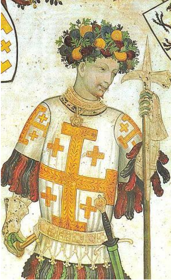
ਗਾਡ ਫਿਰੇ , ਇੱਕ ਫ਼ਰਾਂਸੀਸੀ ਨਾਈਟ , ਪਹਿਲੀ ਸਲੀਬੀ ਜੰਗ ਦਾ ਇੱਕ ਆ ਕੁ ਤੇ ਯਰੋਸ਼ਲਮ ਬਾਦਸ਼ਾਹਤ ਦਾ ਬਾਈ