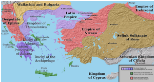
ਚੌਥੀ ਸਲੀਬੀ ਜੰਗ ਦੇ ਬਾਦ ਯੂਨਾਨ ਚ ਕਾਮ ਹੋਣ ਆਲਿਆਂ ਸਲੀਬੀ ਰਿਆਸਤਾਂ