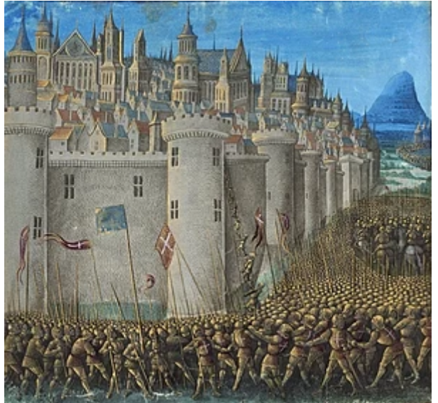
ਪਹਿਲੀ ਸਲੀਬੀ ਜੰਗ ਦੇ ਦੌਰਾਨ ਅਨਿਤਾ ਕੀ ਦਾ ਮੁਹਾਸਿਰਾ

ਸਨ ੧੦੯੫ ਤੋਂ ੧੨੯੧ ਤੱਕ ਫ਼ਲਸਤੀਨ ਤੇ ਖ਼ਾਸ ਕਰ ਕੇ ਬੀਤ ਅਲ ਮੁਕੱਦਸ ਤੇ ਈਸਾਈ ਕਬਜ਼ਾ ਬਹਾਲ ਕਰਨ ਲਈ ਯੂਰਪ ਦੇ ਈਸਾਈਆਂ ਨੇ ਕਈ ਜੰਗਾਂ ਲੜੀਆਂ ਜਿਨ੍ਹਾਂ ਨੂੰ ਤਰੀਖ਼ ਚ ਸਲੀਬੀ ਜੰਗਾਂ ਕਿਹਾ ਜਾਂਦਾ ਹੈ। ਇਹ ਜੰਗਾਂ ਫ਼ਲਸਤੀਨ ਤੇ ਸ਼ਾਮ ਦੇ ਇਲਾਕਿਆਂ ਚ ਸਲੀਬ ਦੇ ਨਾਂ ਤੇ ਲੜੀਆਂ ਗਈਆਂ। ਸਲੀਬੀ ਜੰਗਾਂ ਦਾ ਇਹ ਸਿਲਸਿਲਾ ਲੰਮੇ ਅਰਸੇ ਤੱਕ ਜਾਰੀ ਰਿਹਾ ਤੇ ਇਸ ਦੌਰਾਨ 9 ਵੱਡੀਆਂ ਜੰਗਾਂ ਲੜੀਆਂ ਗਈਆਂ, ਜਿਨ੍ਹਾਂ ਚ ਲੱਖਾਂ ਇਨਸਾਨਾਂ ਦਾ ਕਤਲ ਹੋਇਆ। ਫ਼ਲਸਤੀਨ ਤੇ ਬੀਤ ਅਲ ਮੁਕੱਦਸ ਦਾ ਸ਼ਹਿਰ ਹਜ਼ਰਤ ਉਮਰ ਦੇ ਜ਼ਮਾਨੇ ਵਿੱਚ ਹੀ ਫ਼ਤਿਹ ਹੋ ਚੁੱਕਿਆ ਸੀ। ਇਹ ਸਰਜ਼ਮੀਨ ਮੁਸਲਮਾਨਾਂ ਦੇ ਕਬਜ਼ੇ ਚ ਰਹੀ ਤੇ ਈਸਾਈਆਂ ਨੇ ਲੰਮੇ ਅਰਸੇ ਤੱਕ ਇਸ ਇਲਾਕੇ ਤੇ ਅਪਣਾ ਦਾਹਵਾ ਨਹੀਂ ਕੀਤਾ। 11ਵੀਂ ਸਦੀ ਦੇ ਆਖ਼ਿਰ ਚ ਸਲਜੋਕੀਆਂ (ਸਲਜੋਕ ਸਲਤਨਤ ਤੇ ਸਲਤਨਤ ਰੂਮ ਦੇ ਸਲਜੋਕੀ) ਦੇ ਜ਼ਵਾਲ ਦੇ ਸਮੇਂ ਅਚਾਨਕ ਇਨ੍ਹਾਂ ਦੇ ਦਿਲ ਚ ਬੀਤ ਅਲ ਮੁਕੱਦਸ ਫ਼ਤਿਹ ਕਰਨ ਦਾ ਖ਼ਿਆਲ ਪੈਦਾ ਹੋਇਆ । ਇਨ੍ਹਾਂ ਜੰਗਾਂ ਚ ਤੰਗ ਨਜ਼ਰੀ, ਤਾਅਸੁਬ, ਬਦ ਇਖ਼ਲਾਕੀ ਤੇ ਸਫ਼ਾਕੀ ਦਾ ਜਿਹੜਾ ਮੁਜ਼ਾਹਰਾ ਅਹਿਲ ਯੂਰਪ ਨੇ ਕੀਤਾ, ਉਹ ਉਨ੍ਹਾਂ ਦੇ ਮੱਥੇ ਤੇ ਸ਼ਰਮਨਾਕ ਦਾਗ਼ ਹੈ।