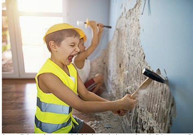
Our two little rascals were very helpful when we had to tear down the living room wall.