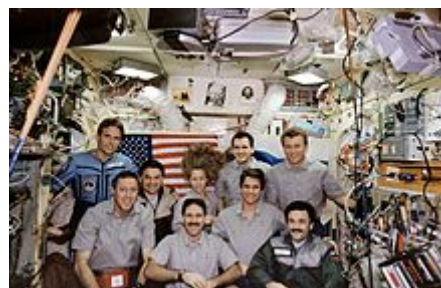
Космонавтҳо ва Астронавтҳо бо Мир.