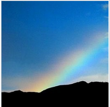
Gökkuşağı resmi olmayan sembolüdürNoahidizm sonra Nuh gördüğü gökkuşağını hatırlatarak, Büyük Tufan İnci'm.

Tarihsel olarak, bazı Rabbiniк görüşler olmayan Yahudiler sadece Tevrat kalan tüm yasalara uymak zorunda değil, ama aslında onları gözlemlemek için yasak değil düşünün.