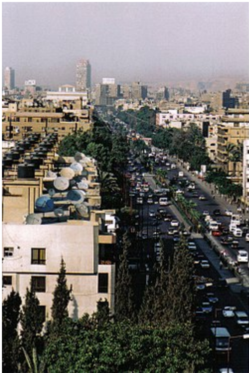
Pyramid Street in Giza