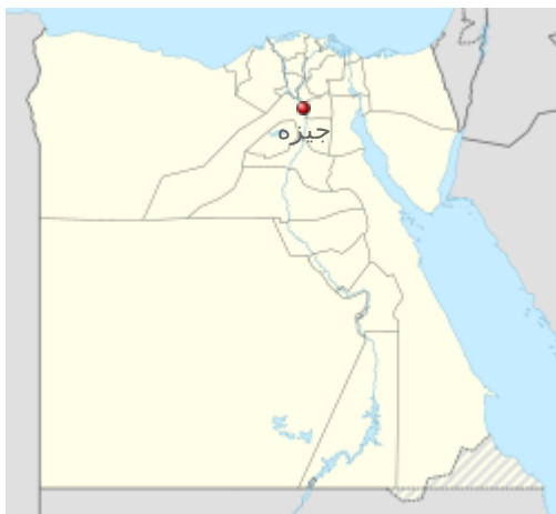
موقعیت در نقشه مصر