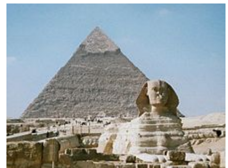
ابولهل و هرم بزرگ جیزه