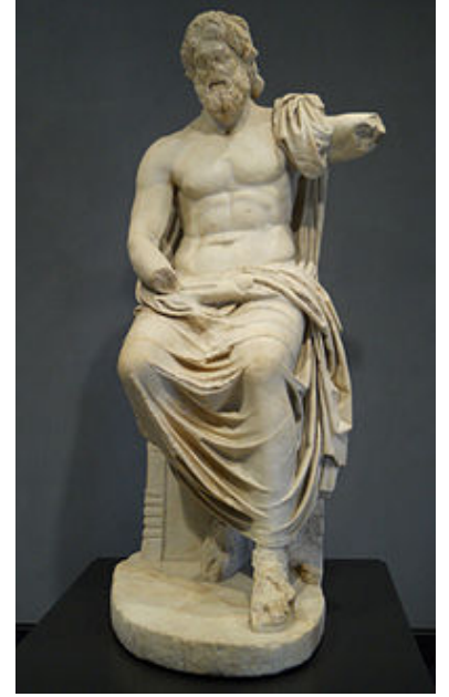
Zeus, Yüce Yunan Tanrısı.

Dünya dinlerinin ve mitolojilerinin ilahlarının özel isimleri vardır. Yunan Tanrısı Zeus , Arap Tanrısı El-Uzzâ , Tengricilik'te Tengri , Musevilik'te Elohim , hem Musevilikte hem Hristiyanlık'ta Yahveh , İslam'da Allah , Zerdüştlük'te Ahura Mazda ile Yezdânizm'deki Yezdân [20][21] bunlara örnek gösterilebilir.