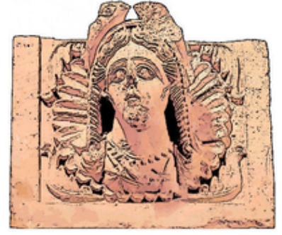
Eski Arap tanrıçası El-Uzzâ meşhur Abduluzza'nın imân ettiği en yüce tanrıça idi.

Türkçede İlah karşılığında cins isim olarak Tanrı , İngilizcede "Deity" , Fransızcada ise "Déité/Divinité" kullanılır.