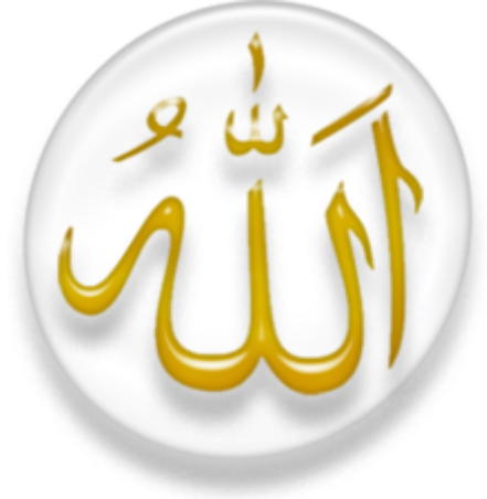
अल्लाह के नाम अरबी में।

अल्लाह (अरबी: الله , अल्लाह ) अरबी भाषा में ईश्वर के लिये शब्द है। इसे मुख्यतः मुसलमानों और अरब ईसायों द्वारा भगवान का उल्लेख करने के लिये प्रयोग में लिया जाता है।