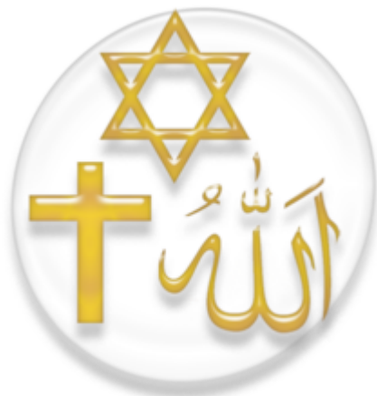
סמליהן של הדתות האברהמיות בימינו: היהדות מיוצגת על ידי מגן דוד (למעלה), הנצרות מיוצגת על ידי צלב (משמאל) ודת האסלאם מיוצגת על ידי קליגרפיה של שמו של אללה.

הדתות האברהמיות הן דתות מונותאיסטיות המדגישות ומזהות את מקורן עם אברהם או שהמסורת הרחנית שלהן מזוהה עמו. [1] הדתות האברהמיות הן חטיבה אחת מתוך שלוש החטיבות הדתיות המרכזיות בתחום הדת השוואתית, יחד עם דתות דהרמיות ודתות מזרח אסיאתיות.